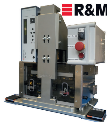
flexiPRESS complètement intégrée dans une presse à blindage pour la confection de câbles chez Reichle & De-Massari AG